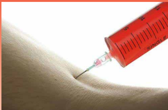
Схема поставки наркотиков тебе в кровь

Наркотики производят и выращивают в разных частях света. Но неизменно они попадают к нам в страну – не щепотками и граммами, а тоннами. Дальше партия драгса распределяется между крупными драг-дилерами, те передают их более мелким... Мелкие дилеры – это, как правило, наркоманы, которые и сами торчат, и других подса-